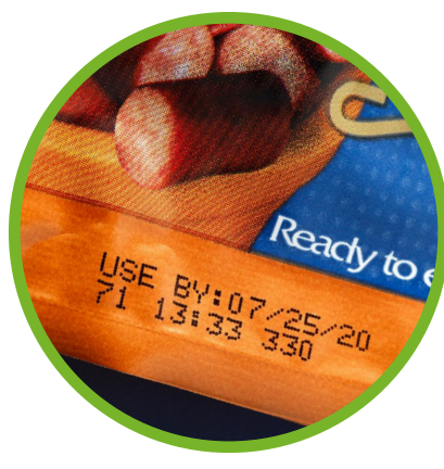
Fleisch und Geflügel