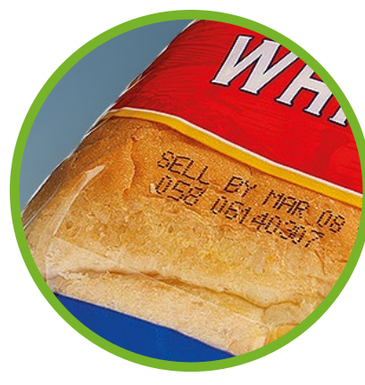
Backwaren und Cerealien