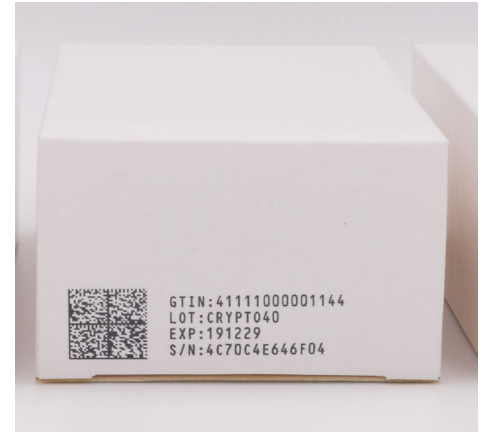
Ein typischer Cryptocode mit einer Symbolgröße von 36x36 Modulen mit einem Wolke m610 advanced gedruckt.

Weitere Informationen finden Sie auf www.videojet.com/code2 .