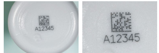
Kontraststarke UV-Lasermarkierung auf HDPE-Flasche