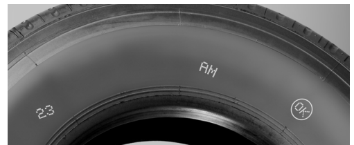
Kennzeichnungen mit hoher Wirkung in Rot, Gelb, Blau und Weiß