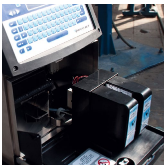
Система подачи чернил Smart Cartridge™ в маркираторе Videojet 1710