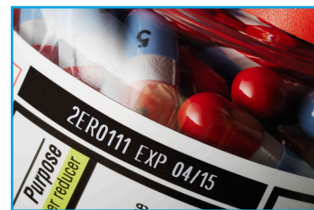
Лазерная маркировка на пластиковых этикетках

В связи с ожидаемым введением требований по обеспечению возможности отслеживания продукции, один из крупнейших в мире производителей офтальмологических препаратов недавно начал реализацию проекта по модернизации систем маркировки на своих производственных линиях.