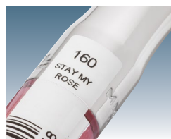
Código impresso em TTO diretamente no rótulo de gloss labial