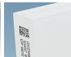
Código de barra TIJ 2D em caixa de papelão