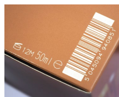
Código de barras a laser no papelão

Marcação de grandes caracteres (LCM) em caixas. A impressão a jato de tinta de grandes caracteres tem bom custo-benefício para personalizar caixas de envio com corrugado padrão. Estes sistemas podem substituir ou personalizar suas caixas de envio pré-impressas, fazendo com que estejam prontas para serem vendidas com fotos de produtos, códigos de barras, logotipos e informações de remessa. Caixas personalizadas ajudam a melhorar a eficiência da sua cadeia de suprimentos e a permitir a adição de sistemas de software que acompanham seu produto por meio do canal de distribuição.