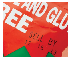
Código de hot stamping de baixa qualidade

Considerando os desafios, a TTO é uma solução de codificação digital efetiva para os produtores de petiscos que usam embalagens de filme flexível. A codificação digital permite trocas de código rápidas e fáceis online, e as tecnologias avançadas de TTO podem ser equipadas com sistemas de software intuitivos e controladores táteis para o usuário. Esses controladores eliminam as suposições (e possíveis erros) na seleção do código. Combinados com os ribbons de alta qualidade otimizados para o ambiente de produção, o tipo das embalagens e os requisitos de codificação, as impressoras TTO podem oferecer aos produtores uma codificação limpa, nítida e de alta resolução, com resultados de qualidade.