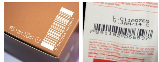
Laserbarcode op karton

Dooscoderen. Dozenprinters bieden een kosteneffectieve manier om standaard verzendverpakkingen van golfkarton te bedrukken. De systemen kunnen uw voorbedrukte verzendverpakkingen vervangen of aanpassen, zodat ze klaar zijn voor de verkoop. Voeg productafbeeldingen, streepjescodes, logo's en verzendinginformatie toe. Dankzij de aangepaste verpakkingen kunt u de efficiëntie in uw logistieke keten verbeteren en softwaresystemen toevoegen die uw product door het distributiekanaal volgen.