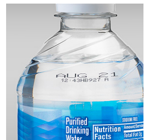
Alimentación y bebidas