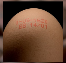
Inyección de tinta continua

Aunque casi todo el mundo utiliza la CIJ por su sencillez, facilidad de integración y naturaleza de codificado pasiva, la solución más adecuada depende de cada aplicación. La principal ventaja del láser frente a la CIJ es su calidad de impresión.