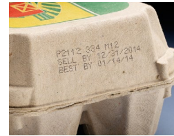
Inyección de tinta en un cartón de papel