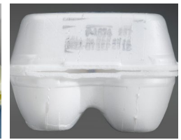
Código mal impreso en un cartón