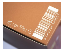
Códigos de barras por láser sobre cartón

Marcaje de caracteres grandes en cajas. La impresión por inyección de tinta de caracteres grandes es una forma rentable de personalizar cajas de envío corrugadas estándar. Estos sistemas pueden sustituir o personalizar las cajas de envío preimpresas preparándolas para su venta a minoristas con fotografías del producto, códigos de barras, logotipos e información de envío. Las cajas personalizadas ayudan a mejorar la eficacia de la cadena de suministro y permiten añadir sistemas de software con seguimiento del producto a través del canal de distribución.