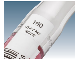
Código termioimpreso directamente en etiquetas de brillo de labios