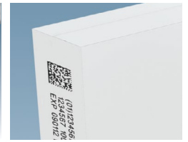
Código de barras 2D TIJ en cartón de papel