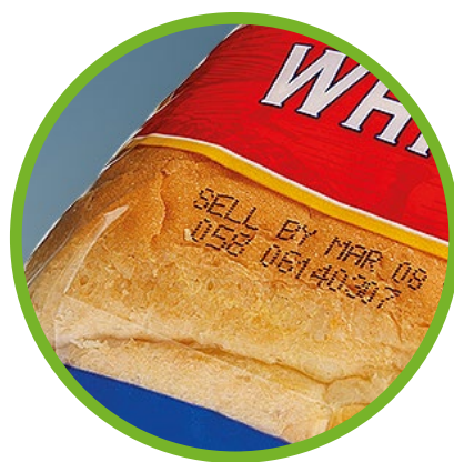
베이커리 및 시리얼