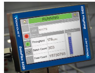
편리하고 직관적인 장비