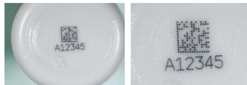
Marcatura laser UV ad alto contrasto su un flacone in HDPE