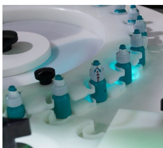
Trasporto dei flaconi su una "ruota a stella" per il controllo durante il processo di marcatura