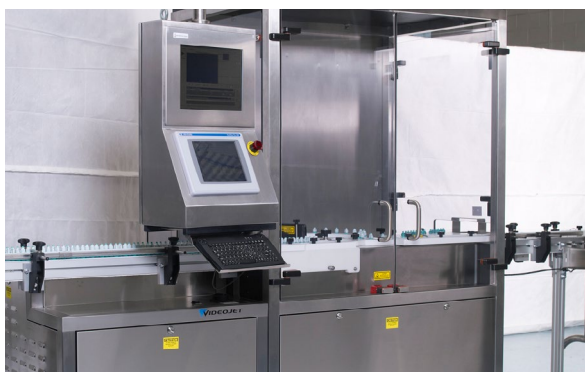
La soluzione di confezionamento di FP Developments con installato il sistema di marcatura laser UV di Videojet

Videojet ha lavorato a stretto contatto con FP Developments per garantire la giusta integrazione dei laser UV nelle relative linee di confezionamento. Con oltre 50 anni di esperienza nella progettazione di tali sistemi, FP Developments ha creato una soluzione per il confezionamento dei materiali molto agevole, requisito fondamentale per effettuare una marcatura di codici DataMatrix di alta qualità a una determinata velocità di linea. Il software del laser UV di Videojet includeva anche la tecnologia di compensazione della curva come funzionalità standard. Questa funzione software ha ulteriormente migliorato la qualità del codice DataMatrix, compensando la traiettoria del prodotto sul dispositivo rotante per il trasporto dei materiali ("ruota a stella"). I requisiti operativi e di codifica variano in base all'azienda, pertanto è fondamentale saper configurare il sistema per soddisfare tali esigenze. Le opzioni di configurazione e i parametri di setup (che possono essere definiti liberamente dall'utente) aiutano le aziende a ottenere facilmente il proprio "livello di rilevamento" del codice.