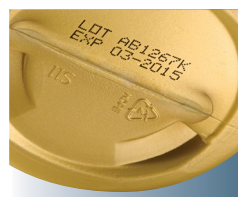
Codice CIJ nero su un flacone colorato

Videojet offre un servizio di laboratorio per campioni ed è in grado di realizzare vari codici utilizzando diverse tecnologie sui vostri imballaggi. Il laboratorio potrà suggerire la tecnologia ottimale per tutti i vostri imballaggi e vi invierà dei campioni per aiutarvi a prendere una decisione informata prima che investiate in una soluzione di codifica.