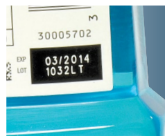
Codice laser in una scatola "knock-out"