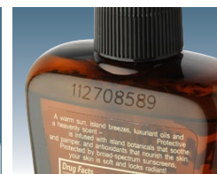
Codice laser spruzzato direttamente sui flaconi