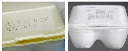
Inkjet auf Polystrol-Eierkarton

CIJ-Drucker können den Bediener und selbst den Sortierer warnen, wenn Druckerprobleme vorliegen, die zu mangelhaft gedruckten Codes führen könnten. Da der Druckkopf nie den Karton berührt, sind CIJ-Drucker nicht anfällig für Druckfehler, die bei Codiergeräten auf Kontaktbasis üblich sind. Viele Drucker der Reihe Videojet 1.000 sind mit unseren CleanFlow™-Druckköpfen ausgestattet, die darauf ausgelegt sind, Druckfehler in Verbindung mit verschmutzten Druckköpfen zu verringern. Auch der tägliche Betrieb der Drucker der Reihe 1.000 ist einfacher, da die Systeme Warnmeldungen ausgeben, wenn Verbrauchsmaterialien zur Neige gehen, und weil das Nachfüllen der Tinte mit nur wenigen Handgriffen und ohne Verwechslungsgefahr möglich ist.