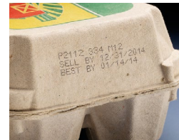
Jet d'encre sur le carton