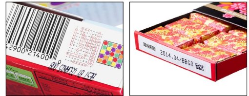
难以辨认且位置错误的编码