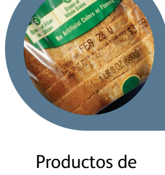
Productos de panadería y cereales