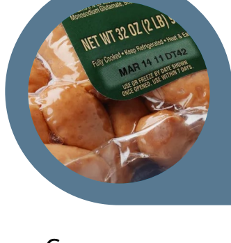
Carnes e aves