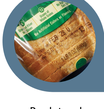
Produtos de panificação e cereais