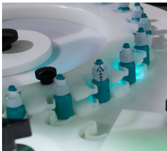
Transporte de roda estrela para controle positivo de frascos durante a marcação