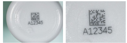
Marca de laser UV de alto contraste no frasco de HDPE