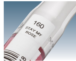
Código impresso em TTO diretamente no rótulo de gloss labial