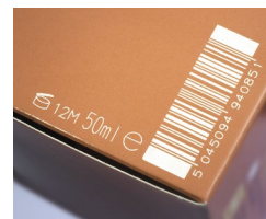
Código de barras a laser no papelão

Marcação de grandes caracteres (LCM) em caixas. A impressão a jato de tinta de grandes caracteres tem bom custo-benefício para personalizar caixas de envio com corrugado padrão. Estes sistemas podem substituir ou personalizar suas caixas de envio pré-impressas, fazendo com que estejam prontas para serem vendidas com fotos de produtos, códigos de barras, logotipos e informações de remessa. Caixas personalizadas ajudam a melhorar a eficiência da sua cadeia de suprimentos e a permitir a adição de sistemas de software que acompanham seu produto por meio do canal de distribuição.