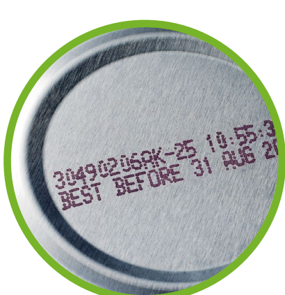
Envasado de alimentación para autoclave