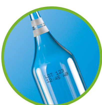
Dispositivos farmacéuticos y médicos