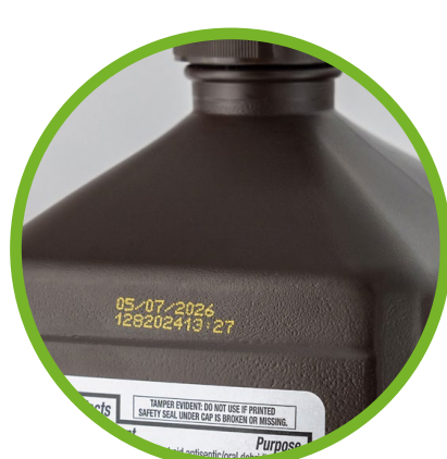
Cuidado personal y del hogar