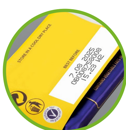
Envasado de alimentación flexible