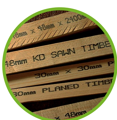
Materiales de construcción