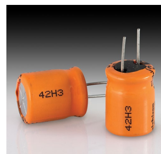
Componentes electrónicos: plástico