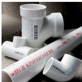
Código láser (cambio de color) Códigos de inyección de tinta continua