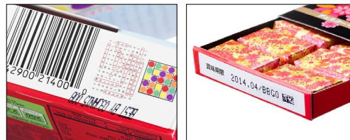
Código ilegible y desplazado