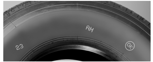
Códigos de gran impacto en rojo, amarillo, azul y blanco